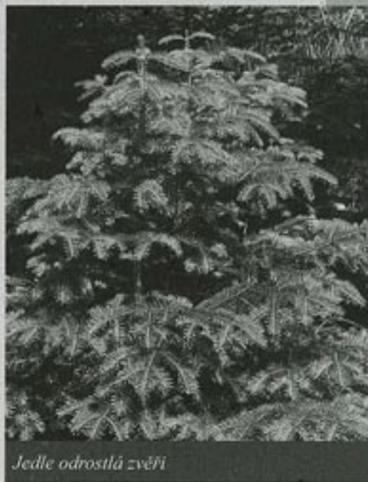
Jedle odrostlá zvěří