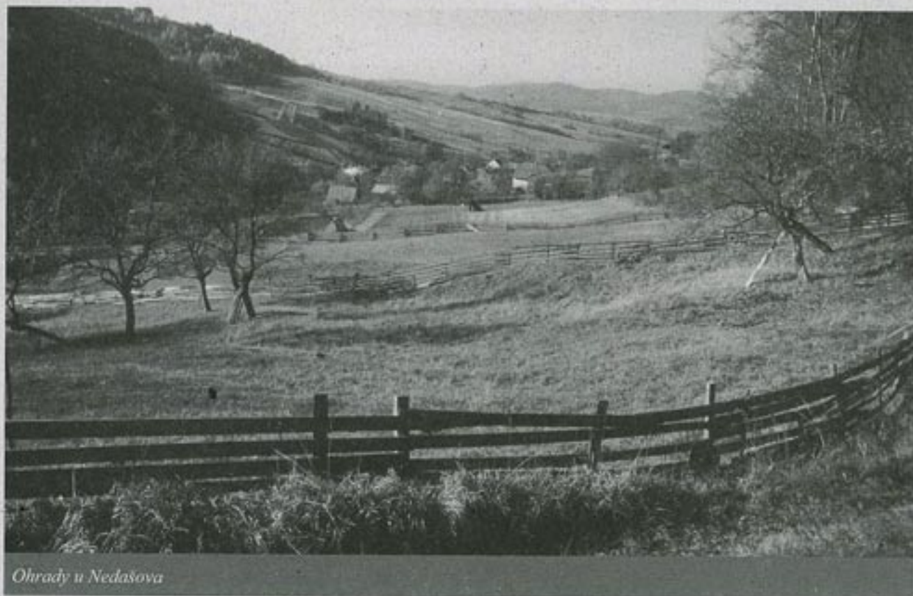
Ohrady u Nedašova