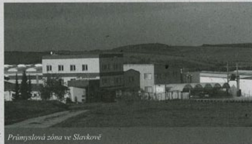
Průmyslová zóna ve Slavkově

jste byl konfrontován se všední skutečností řízení malé a nebohaté vesnice na česko-slovenské hranici. Myslíte si, že za rok jste své nadšení dokázal prakticky zužitkovat, a nebo už nyní pomalu slevujete z původních vizí?