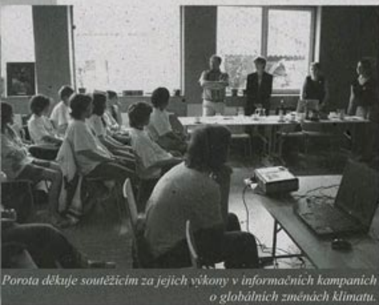
Porota děkuje soutěžícím za jejich výkony v informačních kampaních o globálních změnách klimatu.

Dne 30. května 2007 proběhla ve vzdělávacím středisku Centra Veronica v Hostětíně konference k soutěži „Zlínská CO 2 liga“, která zahrnila první ročník věnovaný problematice klimatických změn, úspor a obnovitelných zdrojů energie.