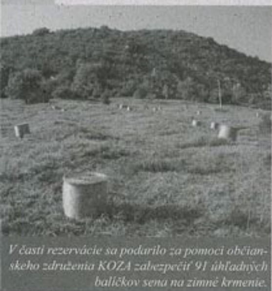
V časti rezervácie sa podarilo za pomoci občianskeho združenia KOZA zabezpečiť 91 úhľadných balíčkov sena na zimné krmenie.

Pokus o zachovanie cenných bezlesných biotopov vykonal toto leto (od mája do októbra) občianske združenie