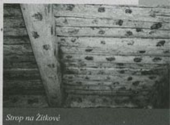
Strop na Žitkově

Černá kuchyně byla totiž místem, kde se dřívě kromě vaření vykonávala řada důležitých domácích prací i rituálů. Z otevřeného ohniště, které se v ní nacházelo, stoupal kouř do komína a pokrýval okolní stěny vrstvou sazí. Hospodyně jednou za čas tyto zakouřené stěny přemazávaly vrstvou hliněné omítky. Používaly k tomu hlinu zředěnou horkou vodou, do které přidávaly dřevěný popel, koňský trus nebo plevy. Ještě před zaschnutím do nové omítky prsty kreslily různé motivy. Nejčastěji to byly svislé vlnovky, kterým se na Hornácku říkalo „hady“ nebo „hádata“. Proč hospodyně k výzdobě svého obydlí volily místo kytiček, ptáčků a tulipánků zrovna plazy? Zřejmě to souvisí s kultem hada hospodářčeka. V lidové víře byl totiž had symbolem duší zemřelých předků a ochraňoval dům před neštěstím. Podle řady bělokarpatkých pověstí měl bílou barvu; někdy byl ozdoben zlatou korunkou a sídlil pod prahem dveří, nebo v blízkosti pece. Užovka stromová se mnohdy vyskytuje v blízkosti lidských obydlí. Do hnojišť klade svá vejce a v okolí sýpek loví škodlivé hlodavce. Lidem tedy i v minulosti velmi prospívala a možná se díky tomu dostala i do jejich mytologie. V Itálii se dodnes objevuje