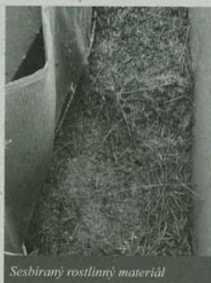
Sesbíraný rostlinný materiál

O myšlenku kartáčového sklizeče jsme se podělili mimo jiné s kolegy z brněnského Rezekvítku, které zaujala natolik, že se rozhodli postavit si něco takového „v malém“. Terény, ze kterých by potřebovali osivo, jsou velmi špatně dostupné a členité, tamní společenstva nízká a řídká. Pro svoje potřeby tedy sestavili kartáčový sklizeč ze zahradní sekačky. Vybrali si model se dvěma převody, kdy přední převod – původně na prořezávání trávníku – uzpůsobili k nesení kartáče a zadní – původně sekačka – předělali na ventilátor, který nasává semena do zásobního vaku. Jenomže co použít na rozlehlé bělo-karpatské louky?