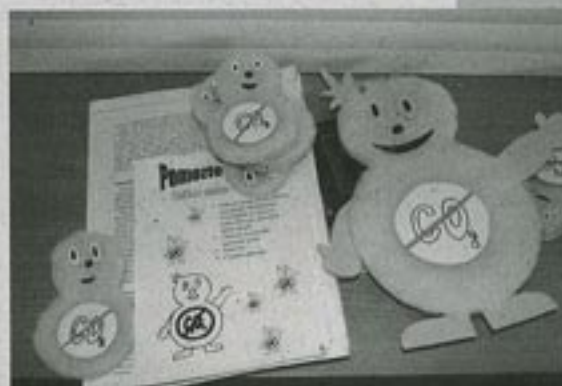
CO 2 -čci, masokti jedné ze soutěžních skupin, provázeli její soutěžní projekt.