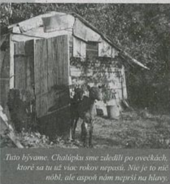
Tuto bývame. Chalúpku sme zdedili po ovečkách, ktoré sa tu už viac rokov nepású. Nie je to nič nóbl, ale aspoň nám neprší na hlavy.

Nad Dolnou Súčou, rázovitou obcou Bielych Karpát, sa týči monumentálne bradlo Krasín. To, že bolo monumentálnym, zabezpečovali v minulosti desiatky kôz, ktoré sa na ňom pásli a nedovolili mu zarásť stromami a krovím. Kozy zmizli, neskôr aj ich náhradníčky – ovce a kravy. Bradlo začalo zarastať a jeho severozápadné svahy sa už premenili na súvislý les.