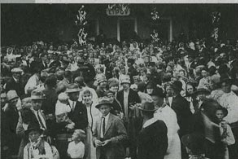
Zahájení provozu, slavnost v Lipově 19. června 1927

Se vznikem nového státu československého po první světové válce a v souvislosti s jeho geografickou polohou vznikala potřeba spojení českých zemí s územím Slovenska. Oproti dosavadnímu trendu v monarchii, kdy spoje byly vedeny především do metropole Vídně ve směru severojižním, se nyní situace změnila a bylo třeba vést spoje směrem západ – východ. Pravda, byla tu už trať z Košic do Bohumína i trať z Brna do Vlárského průsmyku a později do Trenčianské Teplice. Nicméně jeví se jako nedostačující, a to zejména z vojensko-strategických důvodů.