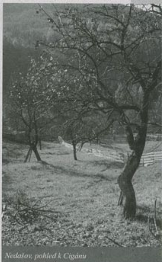
Nedašov, pohľad k Cigánu