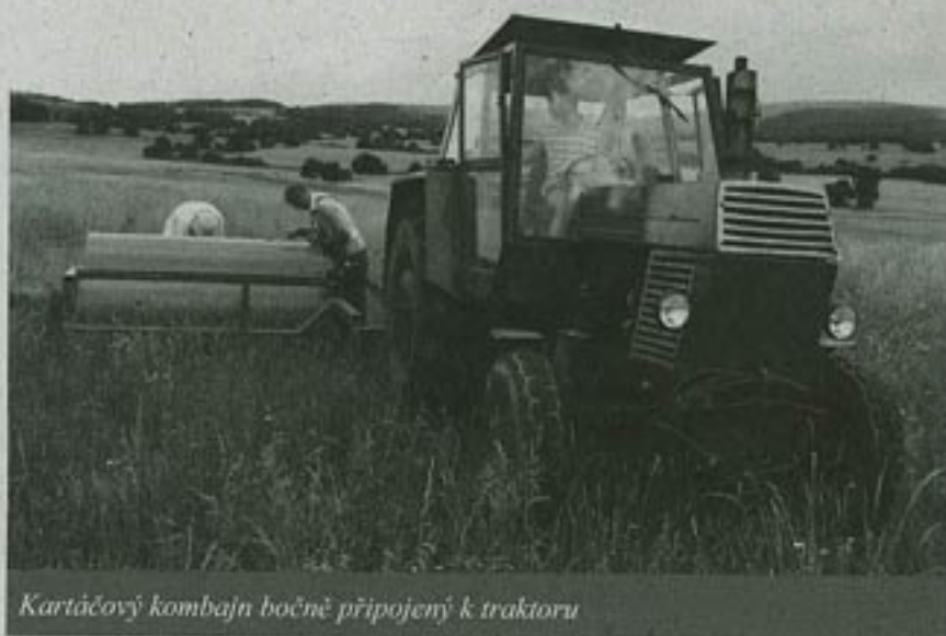
Kartáčový kombajn bočně připojený k traktoru