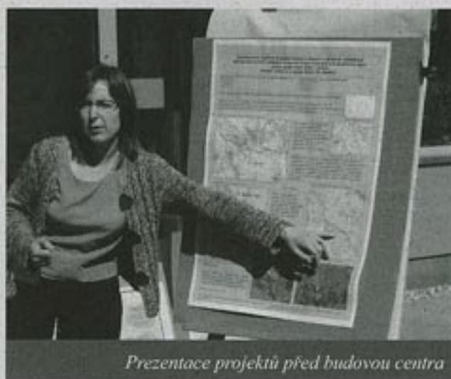
Prezentace projektů před budovou centra

ních úkolů a mladí krajináři se do nich pustili s nadšením. Jedna skupina řešila možnosti úpravy obecního parku, druhá se vydala k sirmatému prameni na okraji obce a třetí se zabývala velkým úkolem v podobě krajinářské úpravy prostoru v okolí bývalého cholerového hřbi-