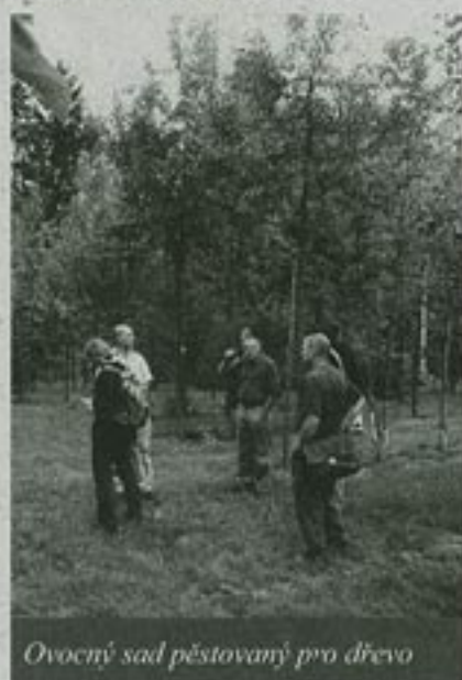
Ovocný sad pěstovaný pro dřevo

a tyto se časem vyřežou. Polovina výšky stromu na dřevo musí být zavětvená, aby strom stále dobře přirůstal. Ač by se zdálo, že takováto plantáž nemůže nést ovoce, opak je pravda. Využívá se ale jen padané či setřásané, sběr v koruně není dost dobře možný. Spoustu ovoce nesou i nízké doplňkové keře.