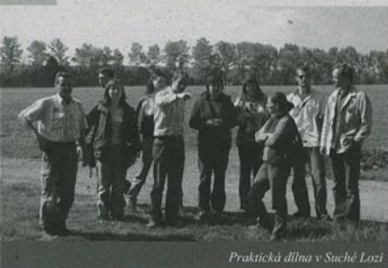
Praktická dílna v Suché Lozi

Škála přitom byla pestrá. Jen namátkou připomínám referát zabývající se vztahem bzenecových vinařů k životnímu prostředí nebo prezentaci, která se snažila odpovědět na otázku, zda těžební území mohou přispívat k biodiverzitě krajiny. Vedle toho se však objevila i témata jako Ochrana krajinného rázu skrze územní plánování, nebo Analýza historického vývoje krajiny se zvláštním zřetelem na její vodní složku. Na konferenci zaznělo takřka třicet příspěvků. Část jich byla s využitím projekční techniky prezentována v interiéru seminárního centra a část za pomoci papírových posterů