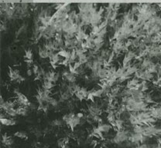
Vrstva machu je pre penovcové prameniská typická, pôsobí ako spongia.

V mozaikovitej bielokarpatskej krajine, budovanej prevažne na „kľzkých“ flyšových vrstvách, sa dodnes môžeme stretnúť s maloplošnými, ale pomerne početnými svahovými mokradami. Hlavnou životnou podmienkou je pre tieto spoločenstvá čistá tvrdá pramenisková voda - odvodnením a intenzívnym hnojením okolných lúk či polí bola preto väčšina pramenísk v minulosti zlikvidovaná.