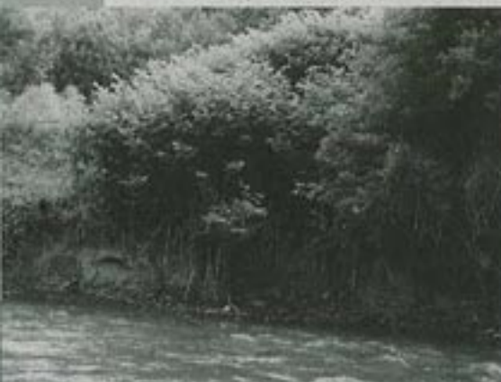
Invázií pohánkovec ( křídlatka ) sa šíri aj malými úločkami hyle. Môže vytvárať rozstahle zárusty.

Zložitý a zdĺhavý systém financovania projektu zapríčinil oneskorenie realizácie niektorých aktivít. Doteraz sa