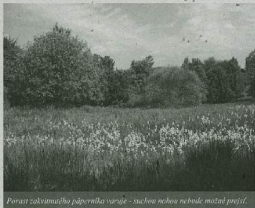
Porast zakvitnutého páperníka varuje - suchou nohou nebude možné prejsť.

S viacerými z mokradných území sme sa už stretli v predchádzajúcich častiach, venovaných lúčnym rezerváciám - v Bošáckej doline PP Grúň, PP Mravcové a PP Blažejová, pri Vrbovcích PP Žalostiná, PP Bučkova jama, PP Šifľovské a PP Malejov pri Chvojnici.