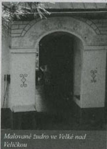
Malované žudro ve Velké nad Veličkou

Tak se stalo, že jsem jednou před lety sbalil spacák, poznámkový blok a tužku a vyrazil za geniem loci na Moravské Kopanice. V mírném dešti jsem procházel rozkvetlými loukami, poslouchal chřástaly a nechal se cestou necestou dovést až na žitkovské Hutě. Opuštěná stodola mi poskytla nocleh a o společnost se postaraly roje světlušek. Druhého dne mě genius loci pozval do jednoho ze svých kopaničářských domovů. Byla jím stará rozpadající se chaloupka s vytlučnými okny a opadanou omítkou. Sotva jsem opatrně vstoupil dovnitř, uvítala mě překvapivá ukázka z prehistorie lidového ornamentu. Strop jedné ze dvou místností totiž stále držel zašedlou omítku a byl pokryt