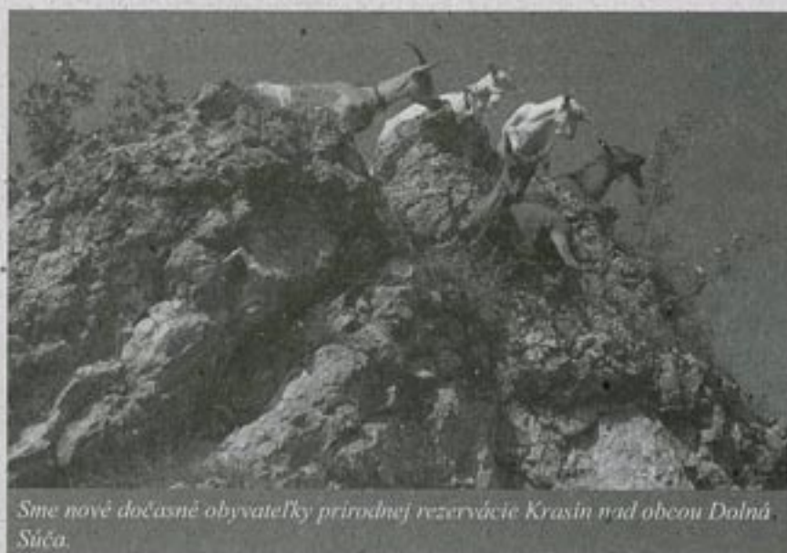
Sme nové dočasné obyvateľky prírodnej rezervácie Krasín nad obcou Dolná Súča.

Pre Prírodu. So súhlasom Správy CHKO Biele Karpaty a tiež so súhlasom užívateľov pozemkov vyhánalo na pašu svoje deväťhlavé stádočko, ktoré v priebehu sezóny narástlo až na štmásťhlavé. Snažili sme sa ukázať miestnym, že ochrana prírody neznamená automaticky zákaz hospodárenia. Ba práve naopak, že aj z takej obrovskej kopy skál môže byť úžitok.