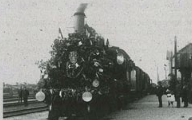
Slavnostní vlak k zahájení provozu v prvním úseku trati z Veselí nad Moravou do Lipova 19. června 1927

velký záměr po-válečného období. Zákon ze dne 30. března 1920 o stavbě nových „železných drah“ a stanovení státního investičního programu na léta 1921–1925 č. 235/20 Sb. rozhodl mimo jiné o vybudování této tratě. Podle citovaného zákona mělo být již v roce 1921 při zahájení stavby čerpáno